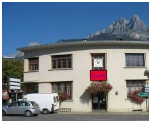
FC Ancienne Poste

Message : texte seul ou visuel à envoyer par mail obligatoirement